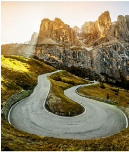
“പശ്ചാത്താപം അനുമാനിക്കുന്നത് ഒരു വിപരീതമായ ദിശാമാറ്റമാണ്.”

പശ്ചാത്താപം സംഭവിക്കുന്നതു ഒരുവൻ ഭൂതകാല പാപത്തെ ഓർത്തു ഖേദിക്കുകയും ക്രിസ്തുവിനെ പിന്തുടരുകയും ചെയ്യുമ്പോൾ ആകുന്നു. പാപത്തിൽ നിന്നും തെറ്റായതിൽ നിന്നും പൂർണ്ണമായി പിന്തിരിയുകയും ഇനി ഒരിക്കലും പിന്നോട്ട് പോകുകയില്ല എന്ന തീരുമാനവും അതിൽ ഉൾപ്പെടുന്നു. പശ്ചാത്താപം അനുമാനിക്കുന്നത് ഒരു വിപരീതമായ ദിശാമാറ്റമാണ്. പല ക്രിസ്തീയ സഭകളും പാപപരിഹാരകനായി യേശുക്രിസ്തുവിനെ പ്രസംഗിക്കുന്നുവെങ്കിലും മാനസാന്തരത്തിന്റെ സന്ദേശം പ്രസംഗിക്കുന്നില്ല. ക്രിസ്തുവിനെ അംഗീകരിക്കുക എന്നതു ഒരു കാര്യമാണ്. എന്നാൽ ദൈവത്തിന് അപ്രീതികരമായ കാര്യങ്ങളിൽ നിന്ന് മാറ്റം വരുത്തുന്നതു മറ്റൊന്നാണ്. രക്ഷ ദൈവത്തിന്റെ ദാനവും, സത്പ്രവർത്തികളാൽ ലഭിക്കാത്തതുമായതിനാൽ നമുക്ക് വ്യക്തിപരമായ ഉത്തരവാദിത്വം ഉണ്ട്. പത്രോസ് അപ്പോസ്തലൻ ജനങ്ങളോട് പറഞ്ഞു “ആകയാൽ നിങ്ങളുടെ പാപങ്ങൾ മാഞ്ഞുകിട്ടേണ്ടതിന് മാനസാന്തരപ്പെട്ട് തിരിഞ്ഞുകൊൾവിൻ..” അപ്പൊ. പ്രവർത്തികൾ 3:19) എന്ന്. തങ്ങളുടെ രക്ഷയെക്കുറിച്ച് ഗൗരവമുള്ളവരോടും, എല്ലാ ഭക്തിഹീനതകളും പൂർണ്ണമായും ഉപേക്ഷിക്കുവാൻ തയ്യാറുള്ളവരോടും മാത്രമേ ദൈവം ക്ഷമിക്കൂ.