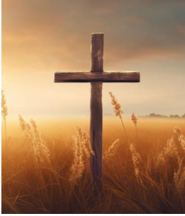
சத்தியம் என்றும் மாறாது. இருப்பினும் மாற்றத்திற்கு இந்த சமுதாயம் இடம் கொடுக்கிறது.

எல்லாவிதமான ஒழுக்க கேடும் பாவமே. அது விபச்சாரமோ வேசித்தனமோ எதுவாக இருந்தாலும் பாவம். கொலோ 3 : 5-6இல் ஆகையால், விபசாரம், அசுத்தம், மோகம், துர்இச்சை, விக்கிரகாராதனையான பொருளாசை ஆகிய இவைகளைப் பூமியில் உண்டுபண்ணுகிற உங்கள் அவயவங்களை அழித்துப்போடுங்கள்.இவைகளின் பொருட்டே கீழ்ப்படியாமையின் பிள்ளைகள்மேல் தேவகோபாக்கினை வரும்.